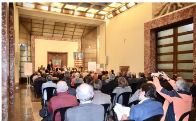
Sala del Gonfalone del Comune di Salerno